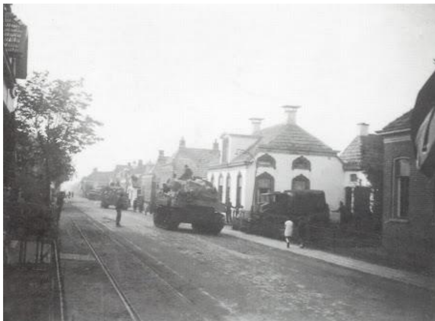
De geallieerden rijden Oostwold binnen

Ik zag vader een sigaar opsteken. Het was zijn laatste sigaar en hij had al maanden eigenbouw tabak moeten roken. Hij had gezegd: " Als de bevrijding komt dan rook ik deze op. " Hij had er vaak aan geroken, maar had zich kunnen bedwingen en had hem telkens weer teruggelegd. En nu stond hij op de hoge stoep buiten te genieten. Ik zie hem nog staan. Wie een vlag had stak hem op. Het was een groot feest! Meisjes uit Oostwold zaten voor en achter op motoren met de rokken tot ver boven de knieën. Alles kon. Meisjes die verkering hadden met jongens uit het dorp liepen nu met Canadese soldaten. Iedereen was door het dolle heen. Zoveel jaren van spanning en nu bevrijd!