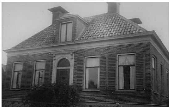
Mijn ouderlijk huis aan de Hoofdstraat