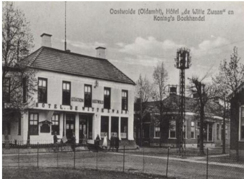
Hotel café De Witte Zwaan

Ik zag zelfs een jongen (Flip Broesder?) met een geweer lopen. Het slagpinnetje was er wel afgehaald. Hij kon er dus niet echt mee schieten. Overal lagen patronen, waar de kogel nog opzat. Die namen we mee naar huis en dan zetten we de patroon in een bankschroef of in een gaatje van een ijzeren paal. Die had je bij het fietshok op het schoolplein. Even wrikken en de kogel zat los. In de patroon zat kruit en daar kon je mooi mee spelen. Je kon er voetzoekers van maken of als je een papieren kokertje maakte en kruit er in deed en dan met een lucifer aansteken dan was het resultaat een mooie vuurstraal van wel 60 cm. Broer Hans en ik maakten van papier enkele bootjes en op elk bootje zo'n papieren kanonnetje. In de wastobbe van moeder lieten we de bootjes drijven en dan probeerden we het bootje van de ander met de vuurstraal in brand te krijgen.