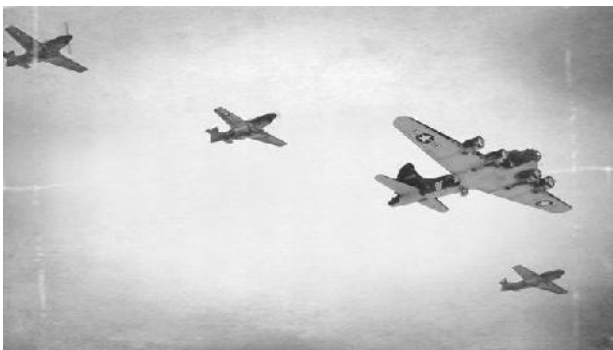
Amerikaanse Boeing B-17, vliegende forten genoemd