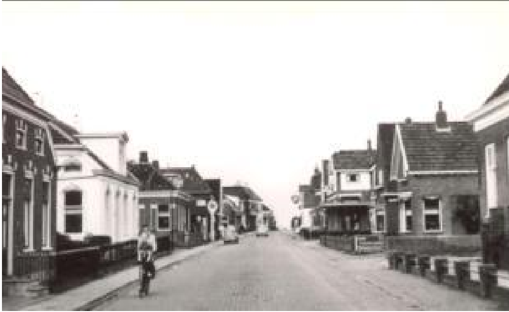
Uiterst rechts onze woning.