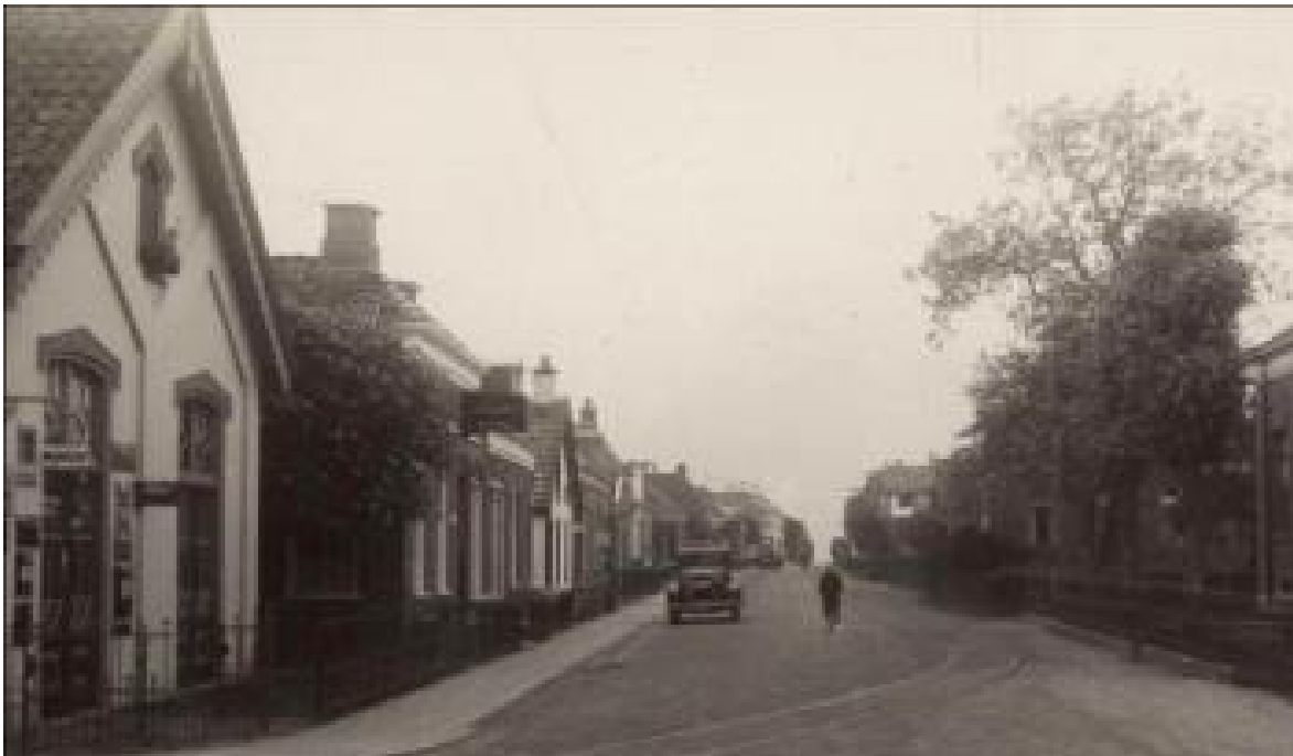
Hoofdstraat waar de knal plaatsvond.