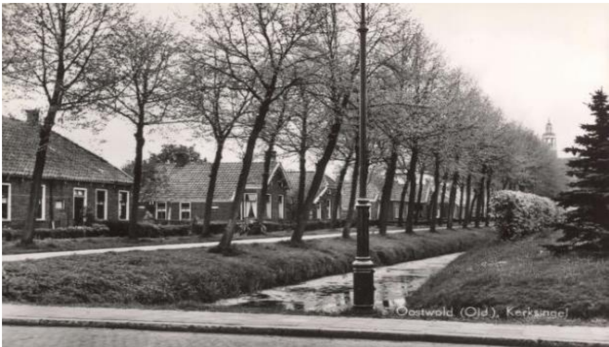
Kerkgracht Oostwold