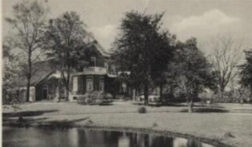
Boerderij van de heer Vlieg

De één na de ander verliet het huis en ging naar zijn eigen woning. Later zag ik, dat op de plek waar ik gestaan had ook een granaat was neergekomen. Het bleken Duitse granaten te zijn die men afvuurde vanaf de Carel Coenraad.